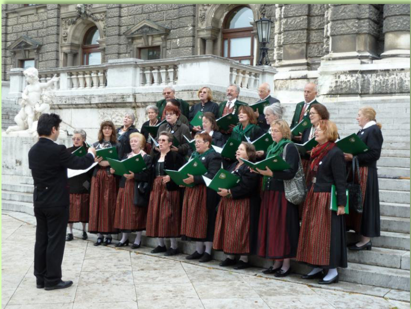
Mai 2011 – Burggarten Wien