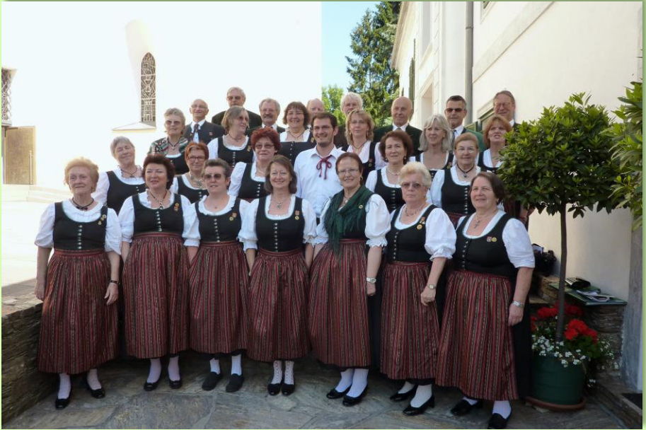
Juni 2012 – Sangerreise Anger bei Weiz