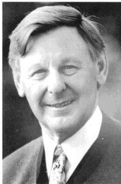
DDR. hc Dr. jur. Friedrich Niederl 15.7.1920 - 19.12.2012